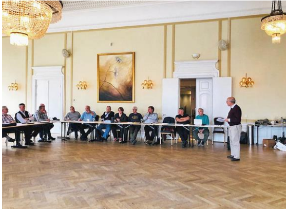
Mötet genomfördes i hotellets eleganta stora festsal. Alla fick god plats.

formation i tryckt form avtar i takt med att sökningar efter sådan via smarta telefoner o. dyl. på Internet tilltar. Dessutom ökar distributionskostnaden påtagligt för den upplaga som trycks.