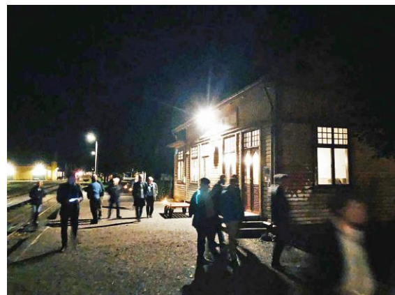
I nattens mörker syntes ett antal skumraskfigurer irra runt kring Antens järnvägsstation. Men, ingen fara. Det var bara MRO-delegater på besök hos AGJ, där både stationshus, café och verkstäder var öppna.

Genom att samla in de revisioner av MRO-föreningar Transportstyrelsen (TS) har gjort de senaste åren, kan föreningarna få mycket gott underlag att uppdatera sina egna säkerhetsföreskrifter på de punkter TS har framfört påpekanden.