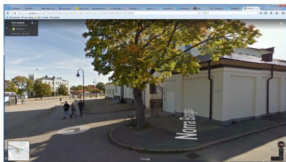
Hotell Fängelset till höger med Västerviks järnvägsstation i bakgrunden.