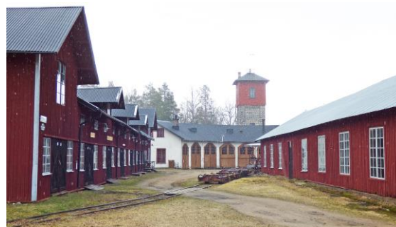
Skyddat : 1880-tal, fast kulturarv, Jädraås.

dade. Ett gammalt fartyg blir skyddat först när det sjunkit till botten som vrak! Det kommer så småningom motioner i riksdagen om att komplettera kulturarvslagen med att också innefatta det rörliga arvet. Hoppas att det blir verklighet. Det påverkar bl.a. våra möjligheter att söka bidrag till underhåll mm. och att skydda dem från att förvanskas genom att ny lagstiftning nu kan tvinga fram kompletteringar som förstör det historiska originalet.