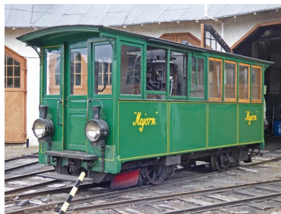
Utan skydd : 1880-tal, rörligt kulturarv, Jädraås. (ångdressin)