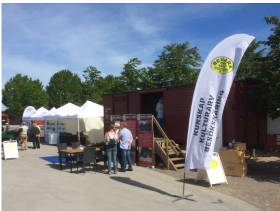
Transporthistoriskt Nätverk i norra hamnen i Visby.