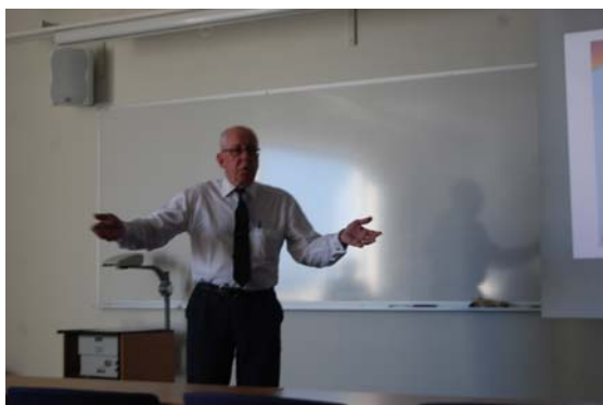
MRO:s ordförande i full action på måndagsmorgonen

Det andra seminariet hölls på onsdagen vid vår vagn. Temat var Levande järnvägmuseer – har Sverige råd att ha dem kvar? Huvudtalare här var förre talmannen Björn von Sydow.