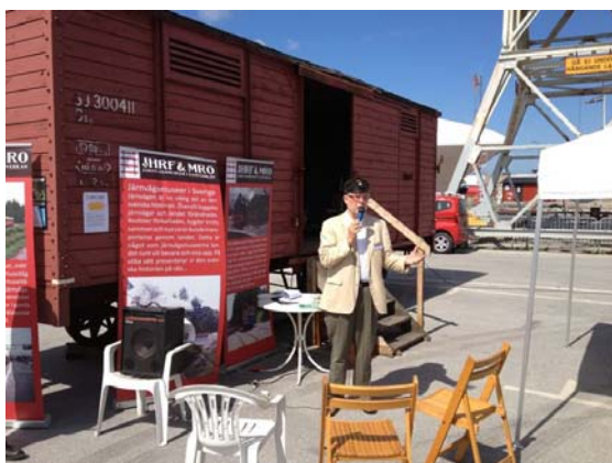
Björn von Sydow i aktion utanför godsvagnen

Det andra seminariet hölls på onsdagen vid vår vagn. Temat var Levande järnvägmuseer – har Sverige råd att ha dem kvar? Huvudtalare här var förre talmannen Björn von Sydow.